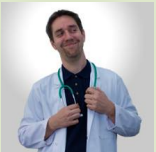
Sven Ludwig allsatis GmbH